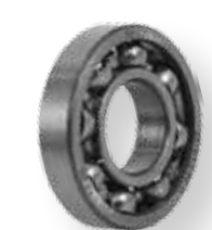
A hajtás orsójának csapágyazása