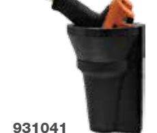
931041 Gumi szerszámállvány

Általában: a szerszám névleges teljesítménye @87 psi (6 bar) levegőnyomásra vonatkozik. Standard berendezés: Függesztőkengyel