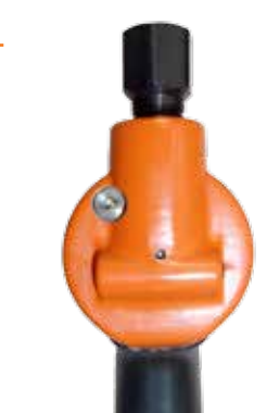
Standard levegőjel-indikátoros szerszámkikapcsolás a Cleco TVP hibamentesítő rendszerrel való használatra